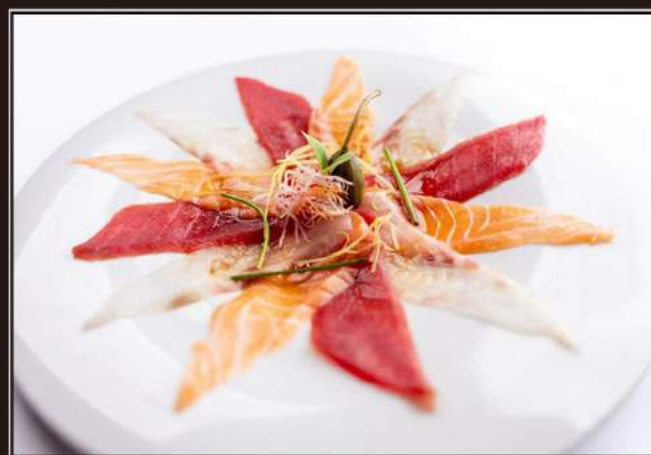
93.Carpaccio misto Tonno, salmone, branzino e salsa ponzu