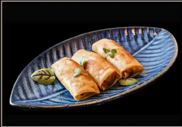
11.Spring roll* Involtini di verdure