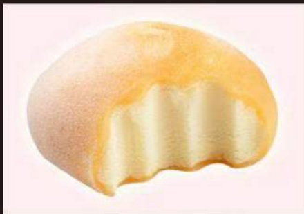
181. MOCHI Frutto della passione 3,00€