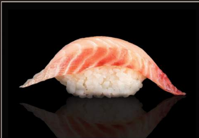
52.Tai nigiri Orata