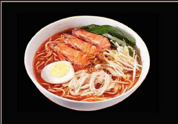
45.Ebi ramen Pasta giapponese in brodo con gamberi* e verdure