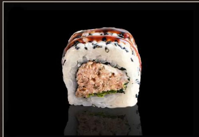
104. Miura uramaki Salmone cotto, philadelphia lattuga, salsa teriyaki