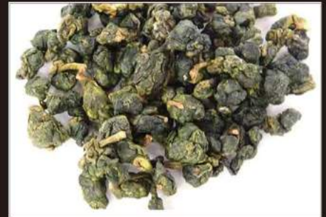
DONG DING The taiwanese floreale 4,00 €