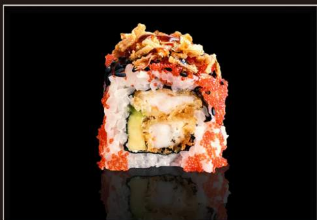
107. Tempura uramaki Gamberoni* fritti, avocado, onion