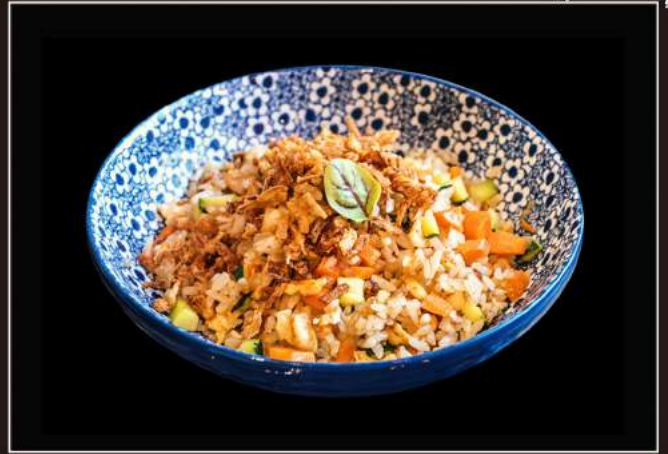
37.Yasai gohan Riso saltato con verdure miste