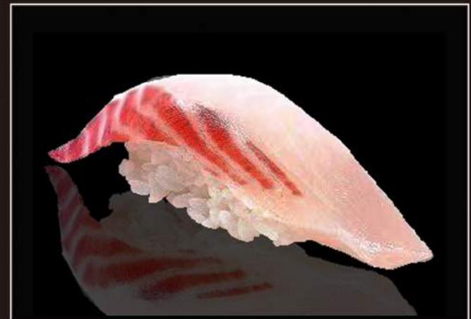
55.Suzuki nigiri Branzino