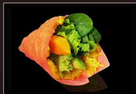
69.Yasai temaki Papaya, avocado, cetriolo, insalata e riso con zafferano