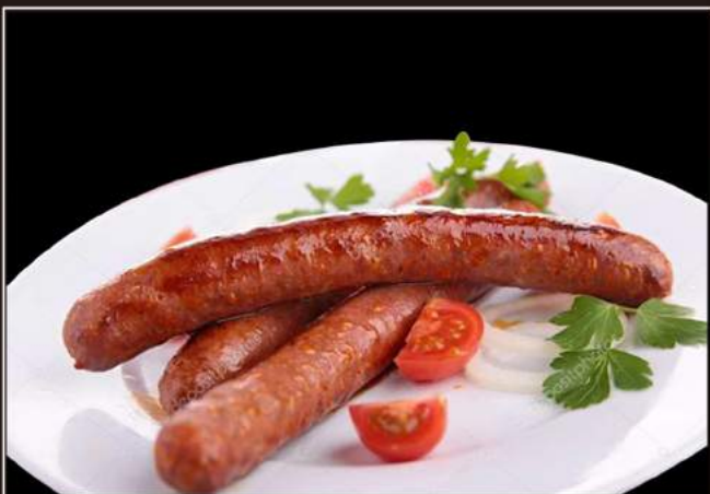
153. Salsiccia Spiedini di salsiccia