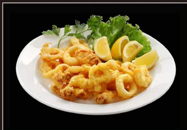
142.Ika tempura Frittura giapponese di calamari*