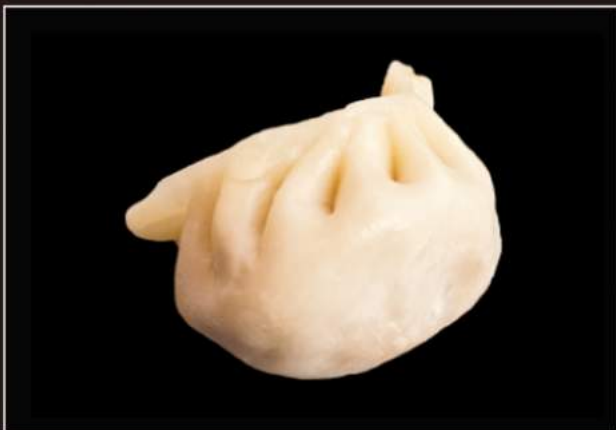
Gyoza (4pz) 16.Ravioli di carne* al vapore 17.Ravioli di carne* alla griglia