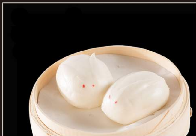
24.Ciambelle* Pane dolce cinese con crema all'uovo