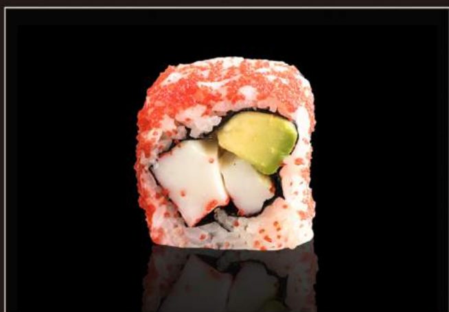
105. California roll Surimi*, maionese, avocado e tobiko