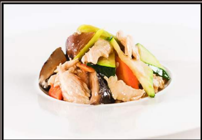
160. Pollo con verdure mista