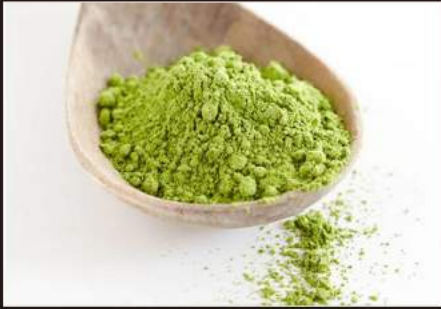
MATCHA TEA The verde giapponese 2,5 €