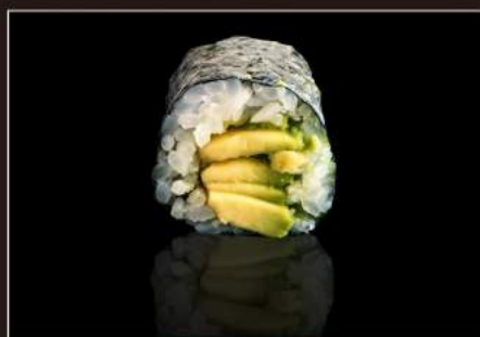
76.Avocado maki Avocado