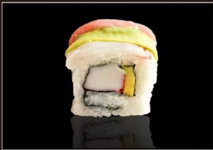
121.Rainbow roll Surimi*, avocado, maionese, pesce misto esterno