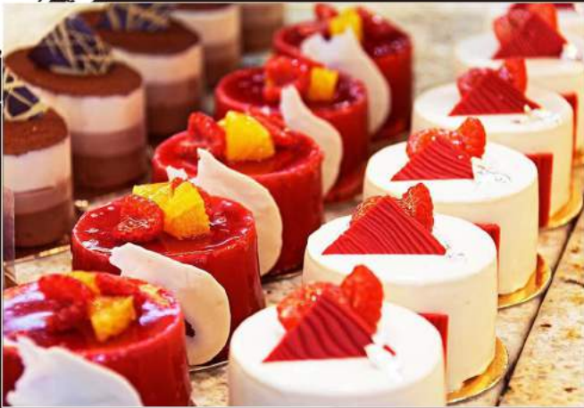
184. DOLCE DEL GIORNO 6,00 €