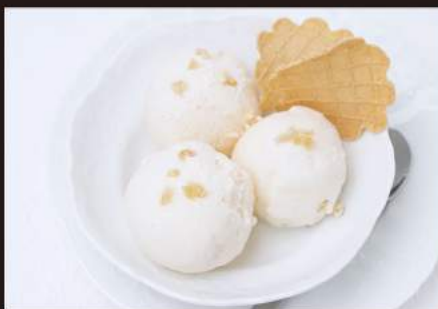
189. GELATO Zenzero 4,00 €