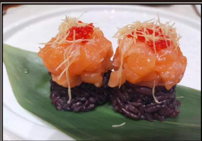
102.Black gunkan Riso venere, salmone, tobiko e kadaif