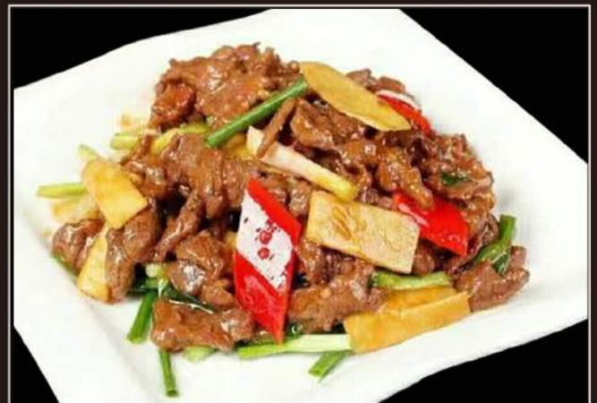
161. Manzo saltato con zenzero e porri