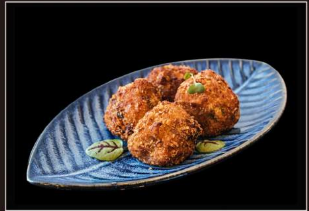
13.Salmon balls Polpette di salmone con bacelli di soia e zenzero