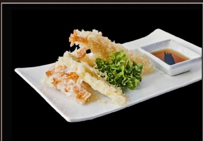
141.Moriawase tempura Frittura giapponese di gamberi* e verdura