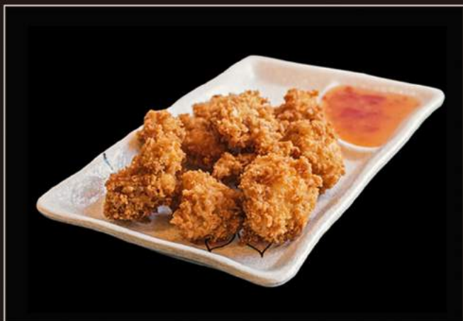
135.Tori kage Pollo fritto giapponese