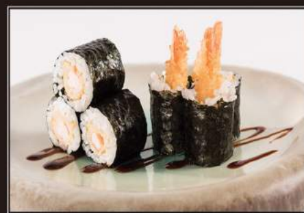
77.Ebi maki Piccoli roll di riso farciti con gamberetti* impananti