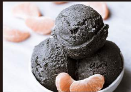
187. GELATO Sesamo Nero 4,00€