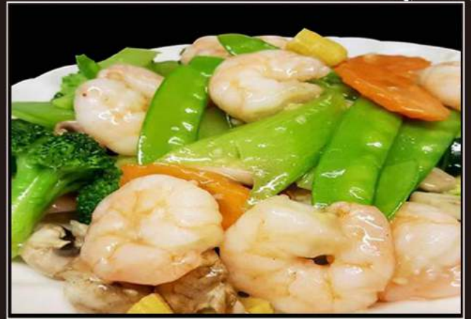
167.Gamberi* con verdure misto