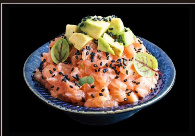
88.Shake tartare Salmone, avocado e salsa tomi