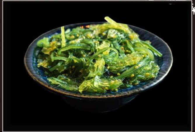
26.Gomma wakame* Alghe piccanti marinate con sesamo