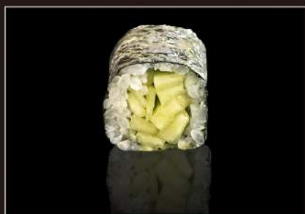
75.Kappa maki Cetriolo