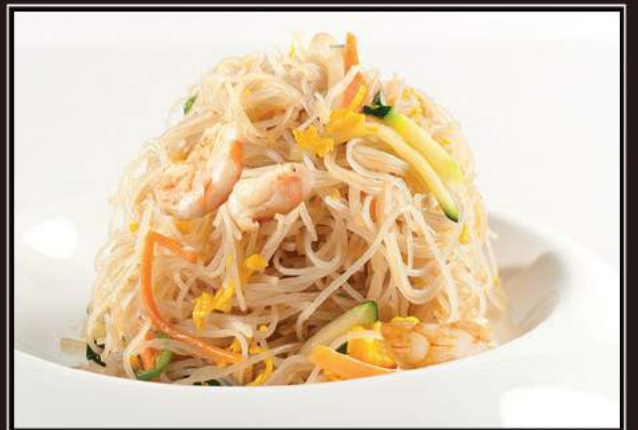
46.Spaghetti riso con gamberi*