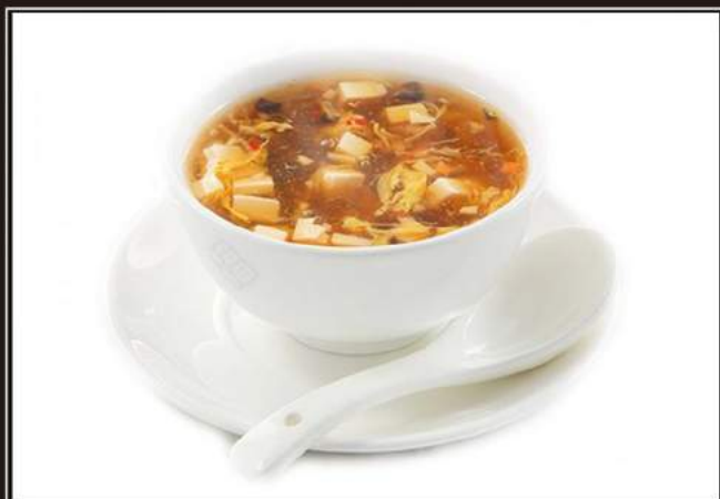
35.Zuppa pechinese Zuppa in agro piccante