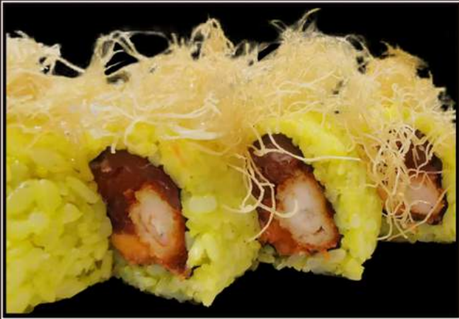
109. Angel roll Gamberoni* fritti, papaya, riso con zafferano e katafi