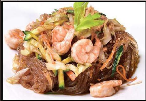
43.Ebi soya Spaghetti di soia con gamberi* e verdure