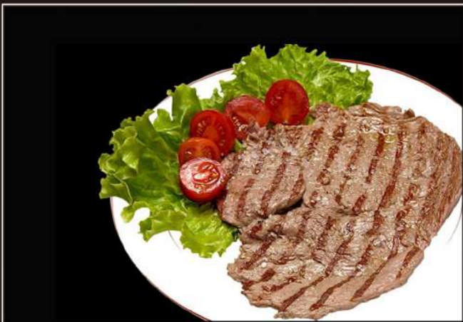
151. Bistecca Bistecca alla piastra