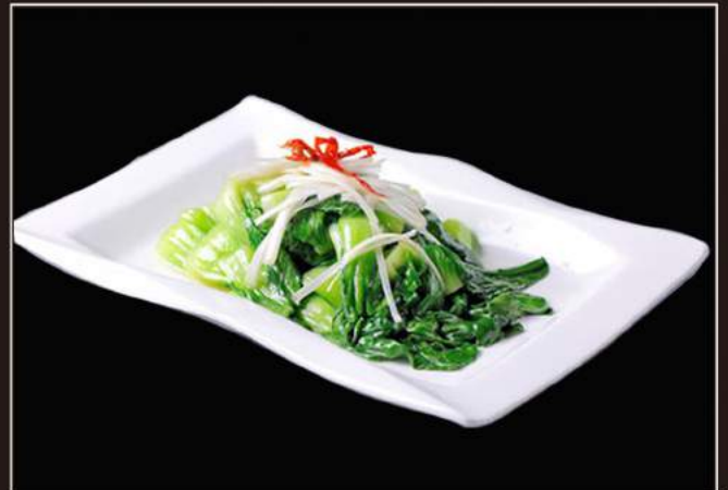
169.Pak choi saltato