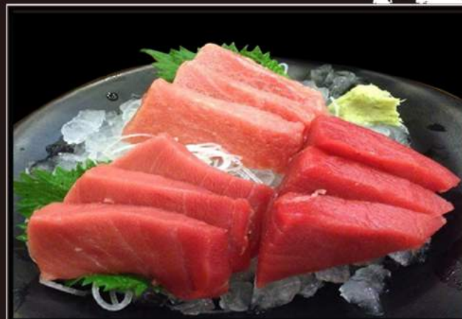
85.Sashimi di tonno (6pz)