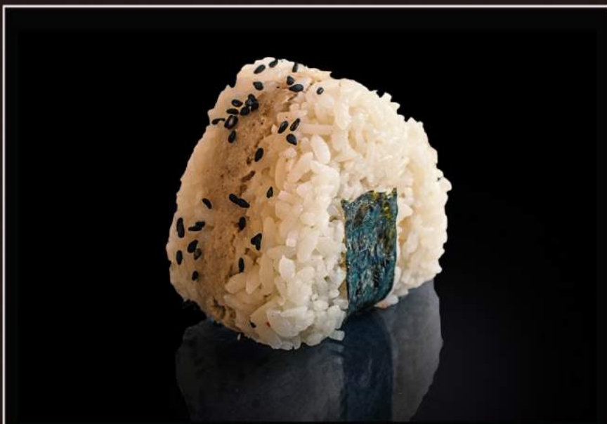
61.Tuna onigiri Polpetta di riso con tonno scottato e maionese