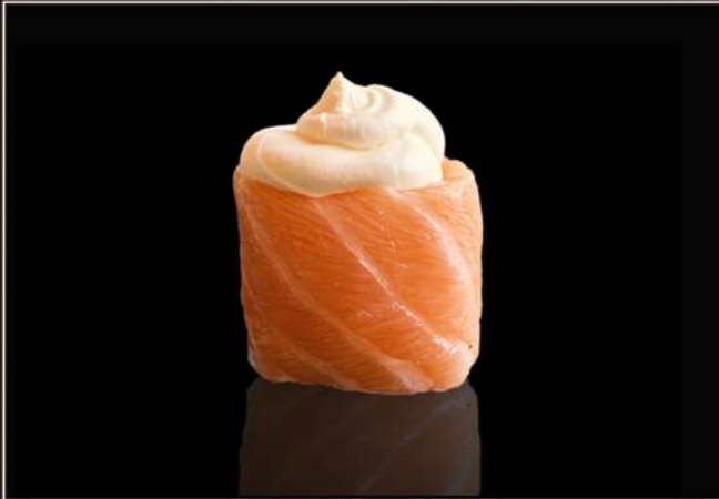
96.Phila gunkan Salmone, tartare philadelphia e katafi

( Possono scegliere max 1 piatti a persona )