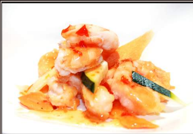
168. Gamberi* in agrodolce