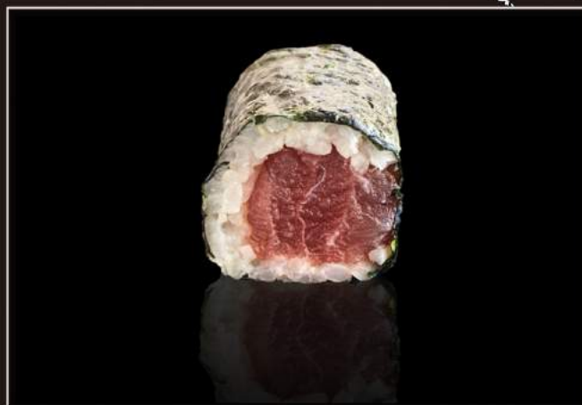
74.Tekka maki Tonno