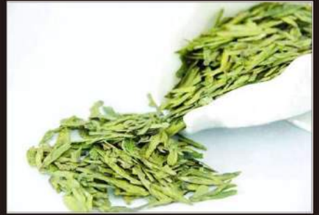
LONGING TEA The verde cinese 3,00 €