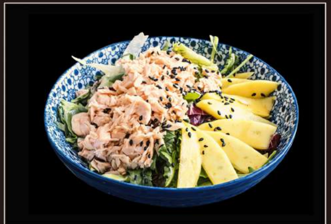
30.Thai salad Insalata di mango e salmone al vapore