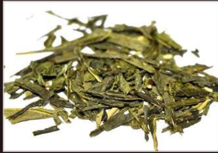
SENCHA TEA The verde giapponese 2,5 €