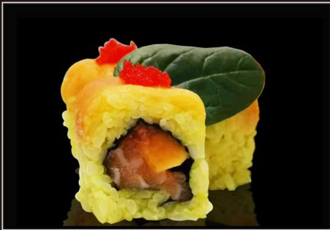
114.Salmon papaya Salmone, riso con zafferano, papaya esterno