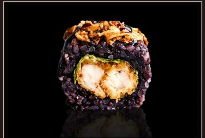
112. Black ebiten Riso venere, gamberoni* fritti, lattuga, maionese, salsa teriyaki e onion