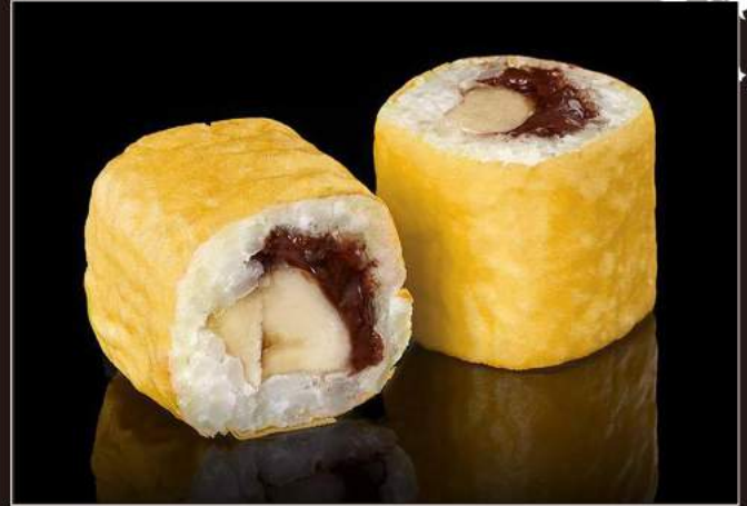
175. FRUIT MAKI Carta di soia, riso, nutella, frutta 176. Fragola 5,00 € 177. Banana 5,00 € 178. Mango 5,00 €