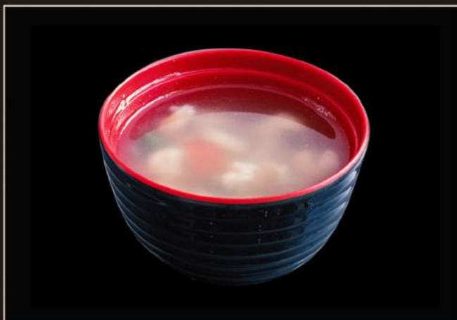
34.Osumashi Zuppa di pesce misto