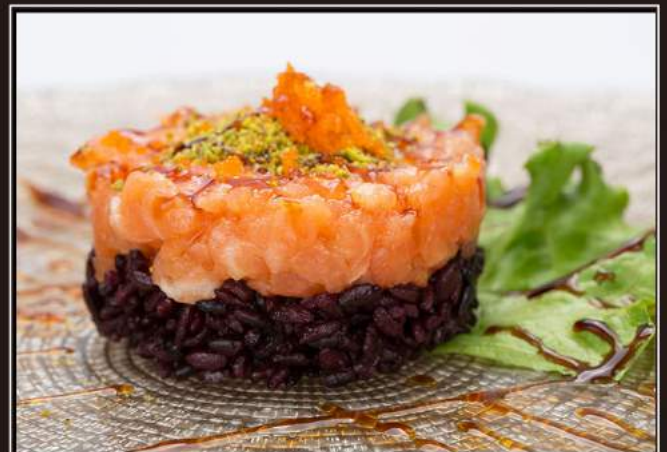
173.Black chirashi Salmone, riso venere, pistachio, tobiko e salsa