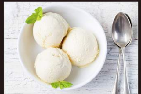
188. GELATO RISO 4,00€