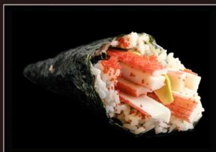
68.Carilfonia temaki Surimi*, avocado, maionese e tobiko