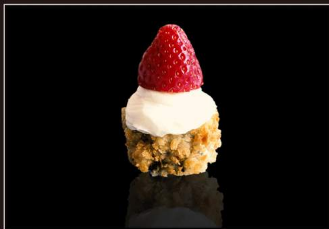
79.Strawberry maki Piccoli roll con salmone, philadelphia, fragole e salsa teriyaki