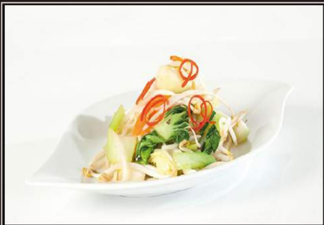
170.Verdure miste saltate