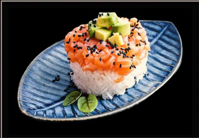
81.Shake chirashi Riso con sashimi o tartare di salmone, avocado e tobiko