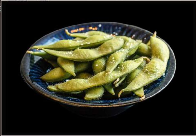
25.Edamame* Bacelli di soia bolliti