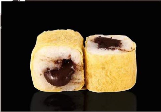
174. NUTELLA MAKI Carta di soia, riso, nutella 4,00 €