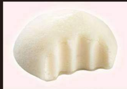
182. MOCHI Vaniglia 3,00€