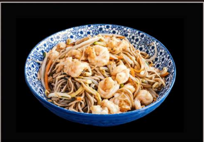
41.Ebi soba Spaghetti di grano saraceno saltati con gamberi* e verdure