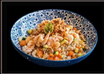
39.Tori gohan Riso saltato con verdure, pollo e uova