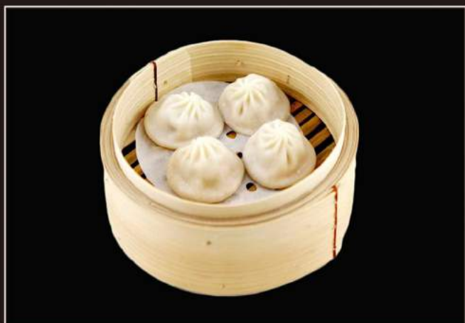
23.Xiaolongbao* Panino lievitato con carne di maiale