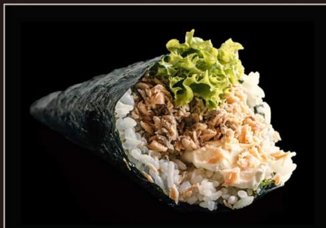
66.Miura temaki Salmone cotto, insalata, philadelphia e salsa teriyaki