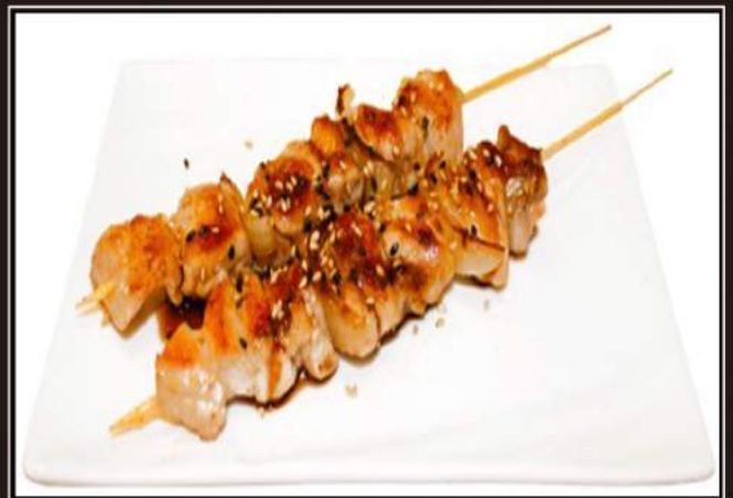
152. Yakitori Spiedini di pollo con salsa teriyaki