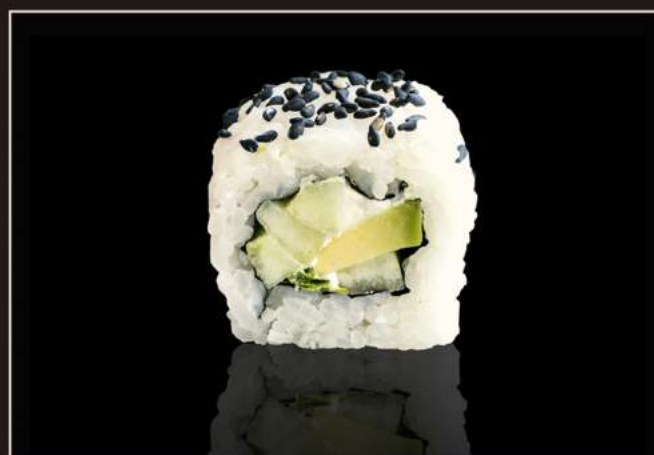
108. Yasai roll Cetriolo, avocado, papaya, lattuga e philadelphia