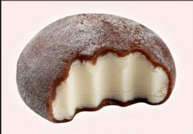
179. MOCHI Cocco e cioccolato 3,00€