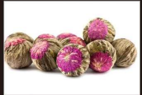
CUORE MAGICO TEA Fiore di the con gelsomino, the verde e amaranto 4,00 €