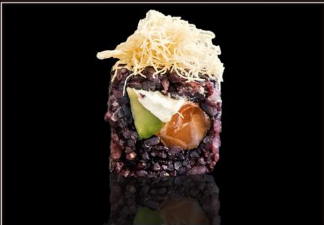
111. Black phila Riso venere, salmone, avocado, philadelphia e salsa teriyaki