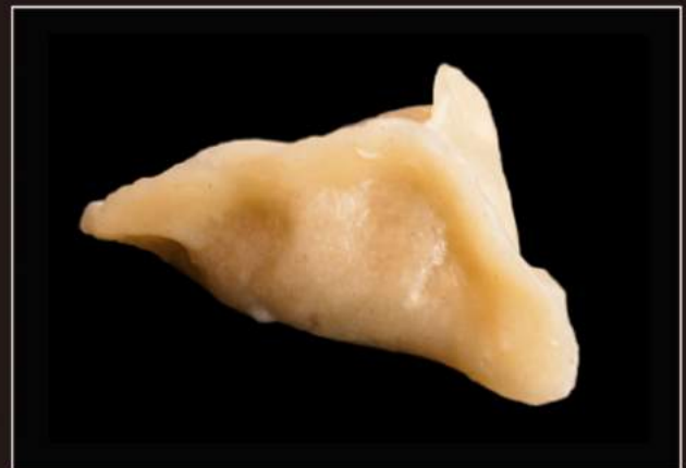
Ebi gyoza (4pz) 18. Ravioli di gamberi* al vapore 19. Ravioli di gamberi* alla griglia