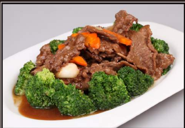
162. Manzo saltato con broccoli in salsa di ostrica