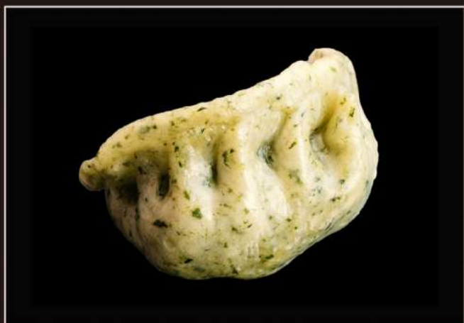
21.Yasai gyoza (4pz) Ravioli di verdure