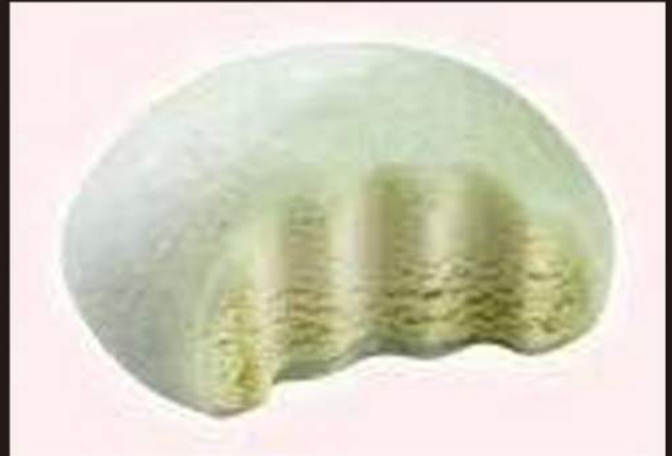
180. MOCHI The verde 3,00€