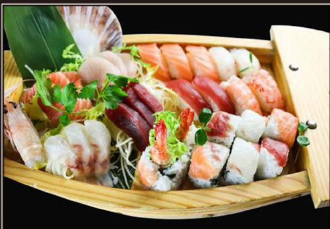
72.Barca tomi* (35pz)