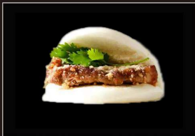
22.Guabao Pane cinese al vapore con salmone impanato e salsa yakiniki