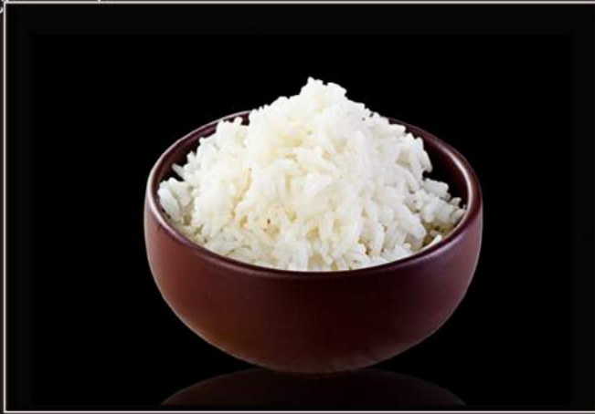
36.Gohan Riso bianco al vapore