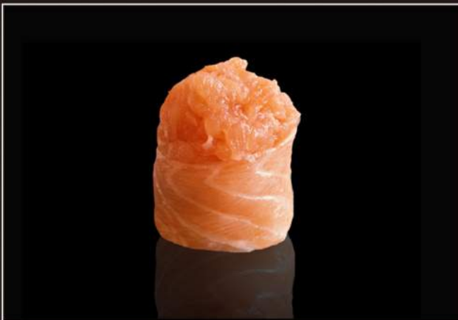
98.Spicy salmon gunkan* Salmone esterno e tartare di salmone piccante