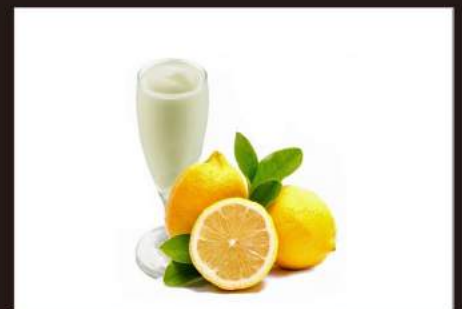
191. SORBETTO Limone 3,50 €