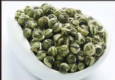
DRAGON PEARLS TEA The aromatico con gelsomino e foglie di the verde 4,00 €