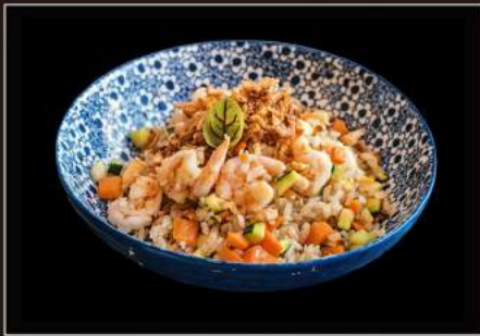
38.Ebi gohan Riso saltato con verdure e gamberi*