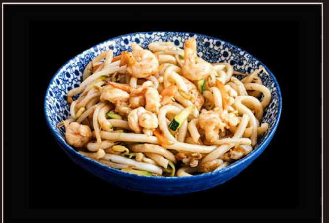
42.Yaki udon Spaghetti di riso saltati con frutti di mare