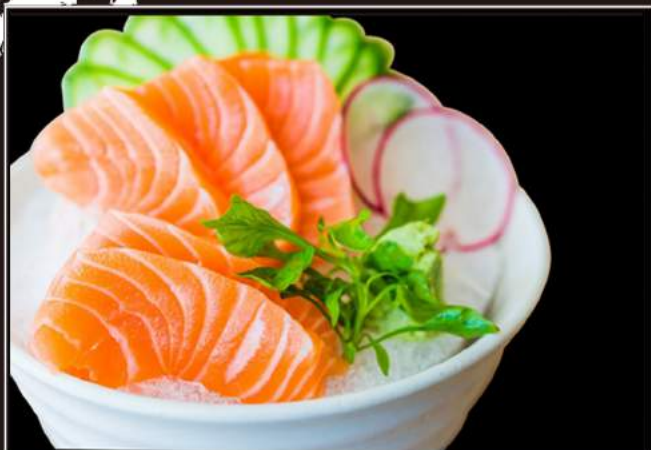
84.Sashimi di salmone (6pz)

( Possono scegliere max 2 piatti a persona )