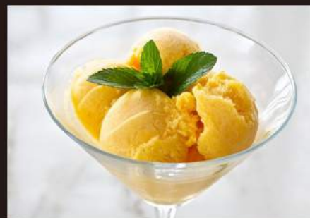
190. SORBETTO Mango 4,00 €