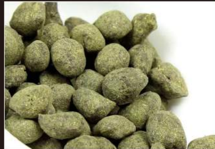
GINSENG OOLONG TEA The cinese al ginseng 4,00 €