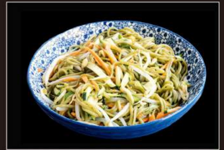
40.Yasai soba Spaghetti di grano saraceno al the verde saltati con verdure