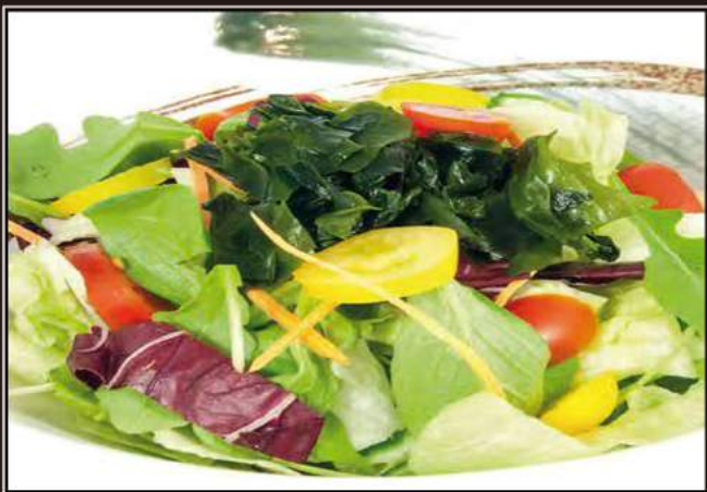
29.Veggie salad Insalata mista