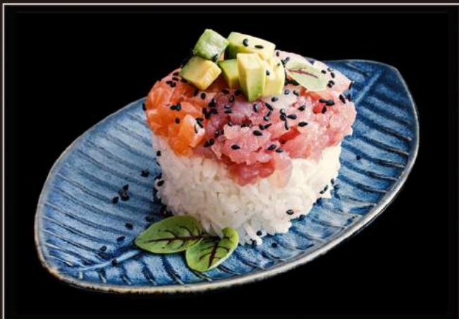
83.Mixed chirashi Riso con sashimi o tartare di pesce misto, surimi*, avocado e tobiko