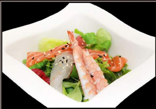
27.Sashimi salad Insalata con misto di pesce