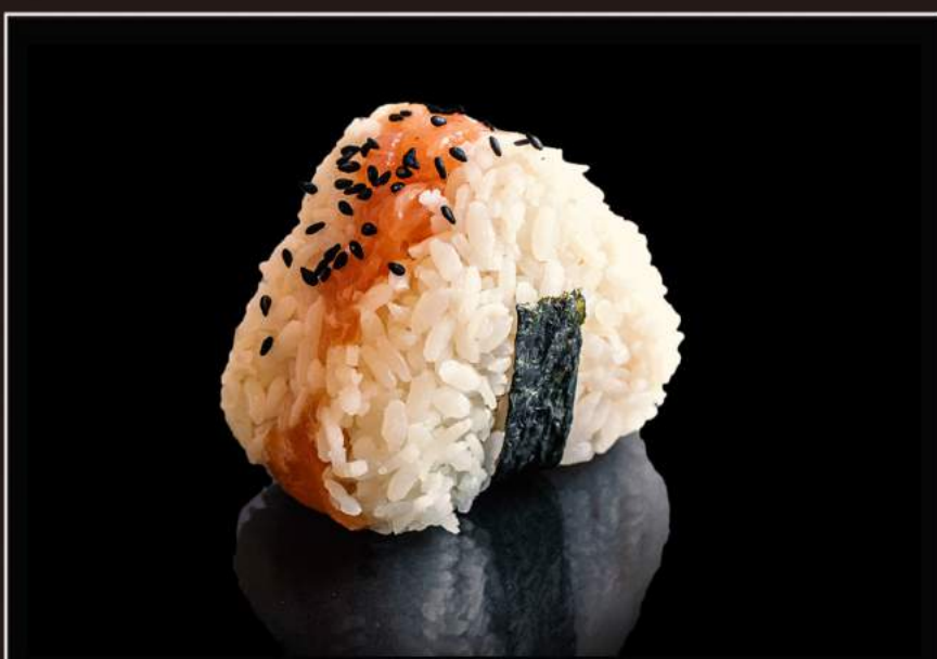
62.Shake onigiri Polpetta di riso con salmone e philadelphia