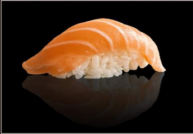
50.Sake nigiri Salmone