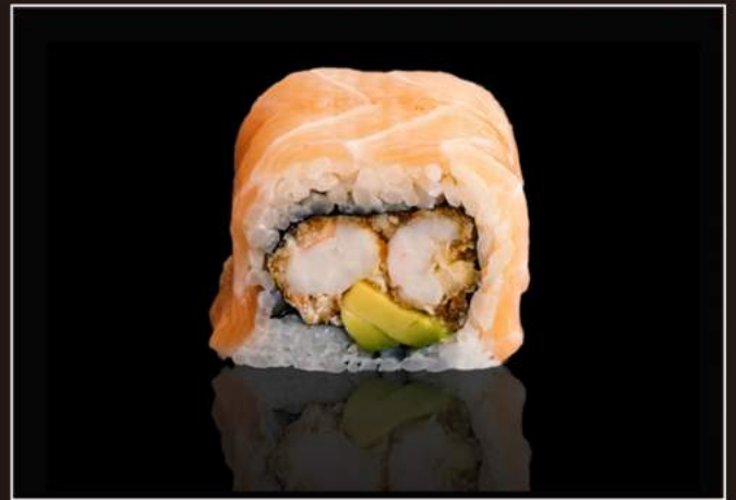
119.Banzai roll Gamberoni* fritti, avocado, philadelphia, salmone esterno