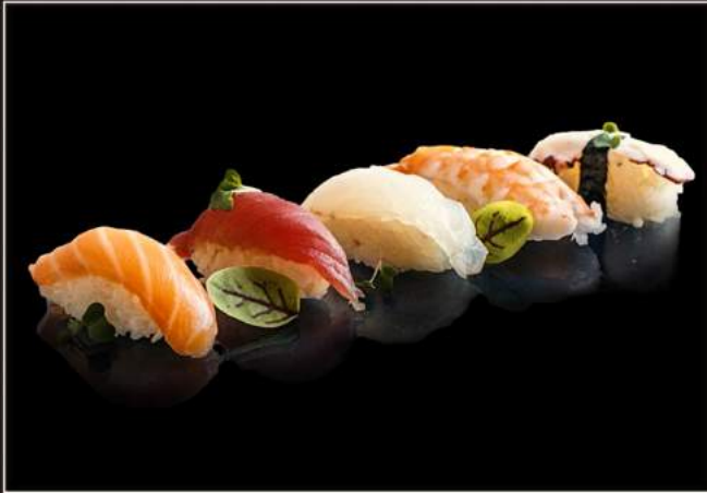
70.Nigiri mixed* (8pz)