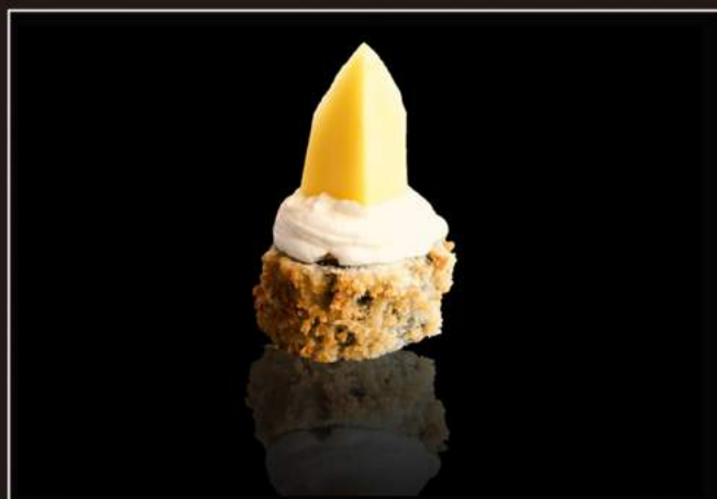
78.Mango maki Piccoli roll con salmone, philadelphia, mango e salsa teriyaki