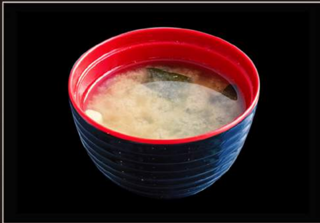
33.Miso shiro Zuppa di miso con alghe e tofu