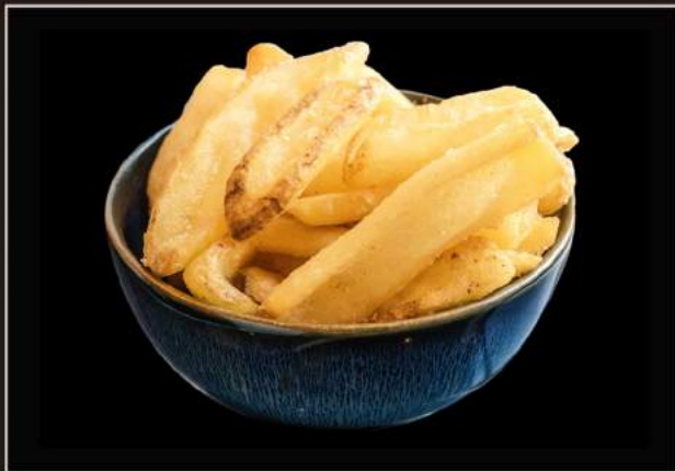
14.Patatine* Patatine fritte