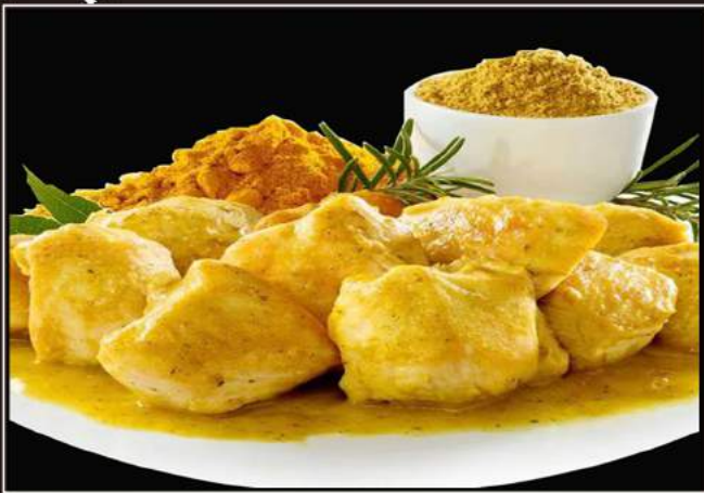
157. Pollo al thailadese Pollo con curry e latte di cocco