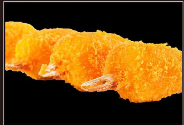
15.Chele di granchio* Chele di granchio fritte