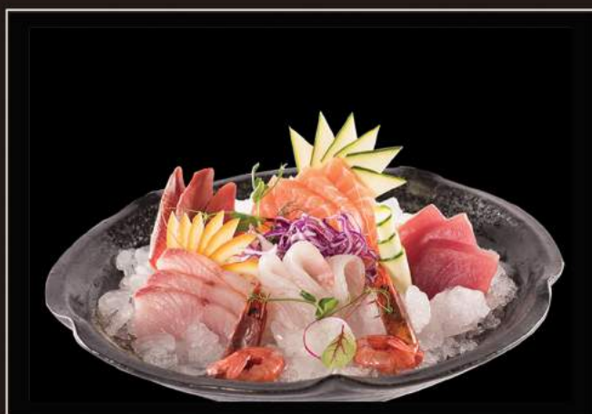
86.Sashimi mix (6pz)