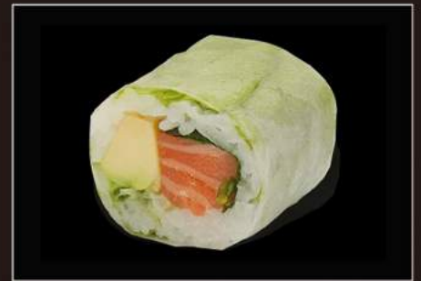
124.Fresh salmon (4pz) Salmone, insalata e avocado, sfoglia di riso