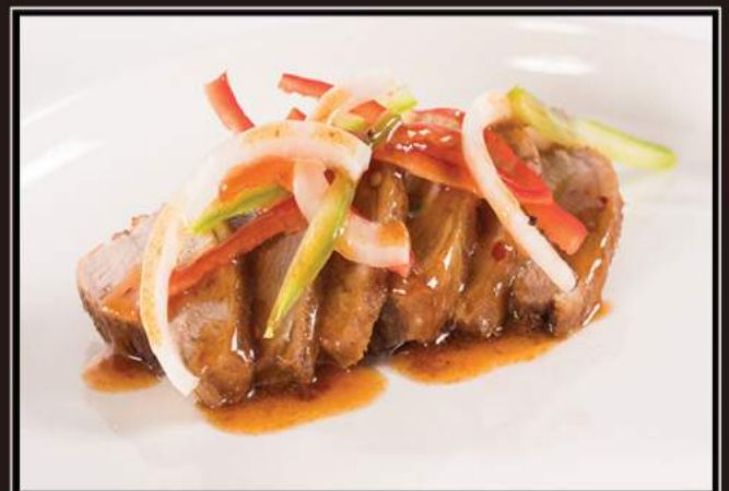
163. Anatra con salsa piccante