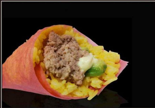
63.Tuna temaki Riso con zafferano, tonno cotto , avocado e maionese