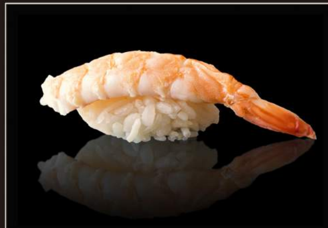
54.Ebi nigiri Gambero*