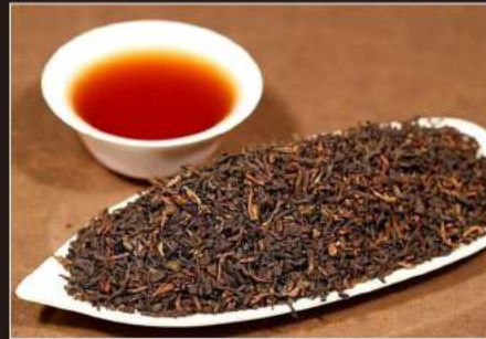
PUERH TEA The cinese invecchiato 4,00 €