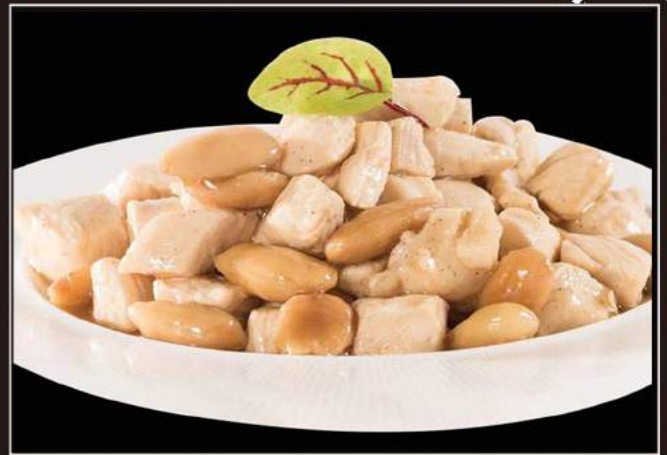
158. Pollo alle mandorle