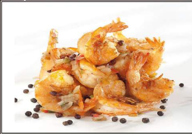
166.Gamberi* con sale e pepe