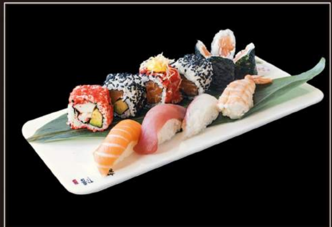
71.Sushi mixed* (12pz)