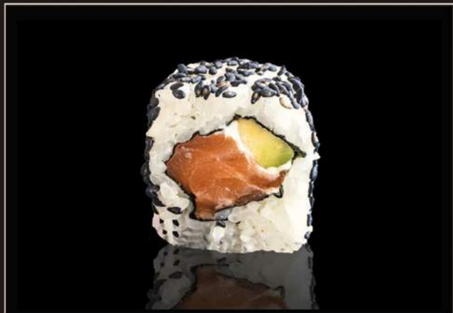
103. philadephia roll Salmone, avocado, philadelphia