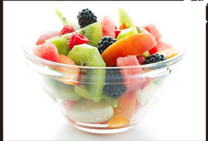
185. MACEDONIA 3,50€