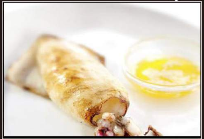
149. Ika tenppayaki Calamari* alla piastra