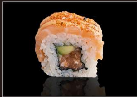
122.Spicy salmon roll Salmone, avocado, salsa spicy, salmone esterno