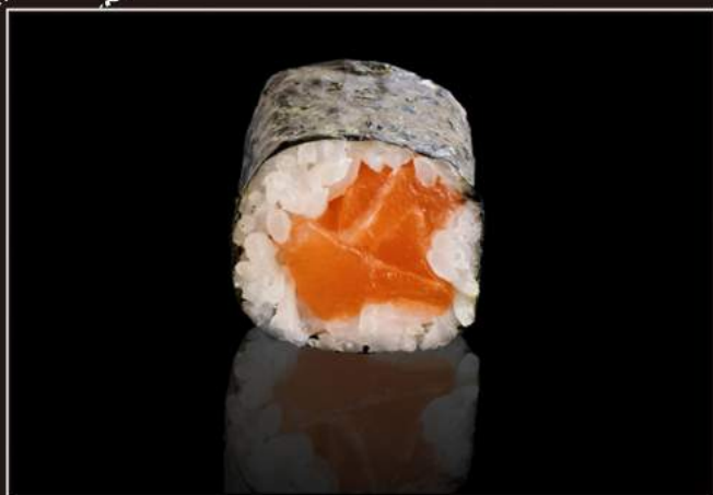
73.Sake maki Salmone