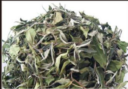
BAIMUDAN TEA The bianco cinese 4,00 €