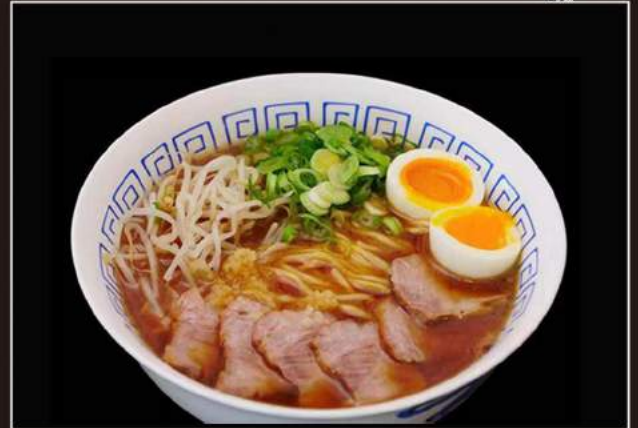
44.Ramen Pasta giapponese in brodo con carne e uova