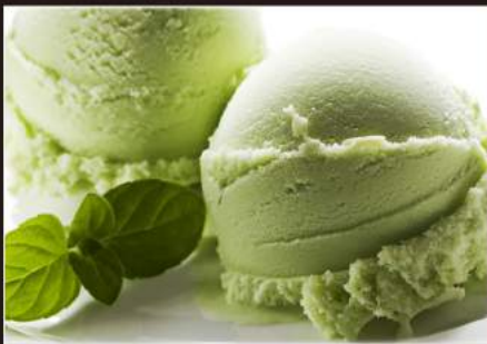
186. GELATO The verde 4,00€