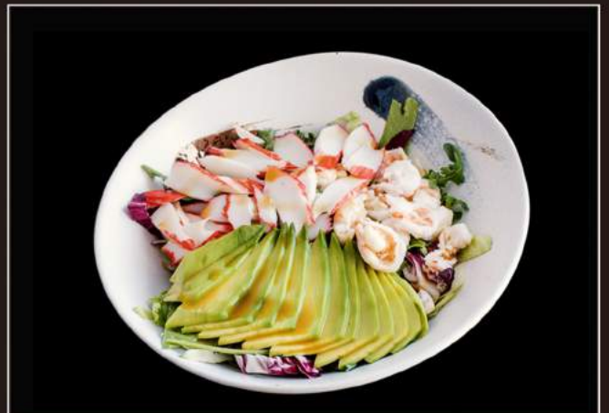
28.Ebi salad Insalata con gamberi*, surimi e avocado