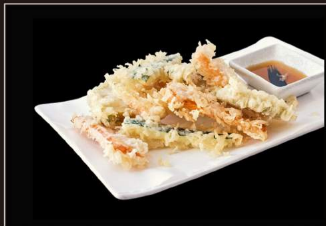
140.Yasai tempura Frittura giapponese di verdure