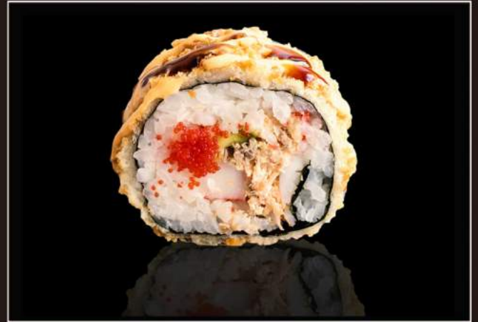
110. Futomaki fritto Salmone, avocado, gamberoni* al vapore, surimi, tobiko, salsa teriyaki e salsa piccante