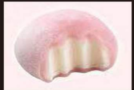
183. MOCHI Ciliegia 3,00€