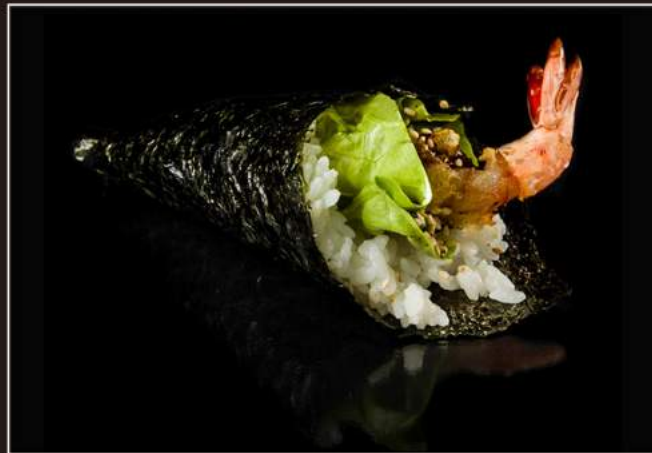
64.Tempura temaki Gambero* fritto, salsa teriyaki, avocado