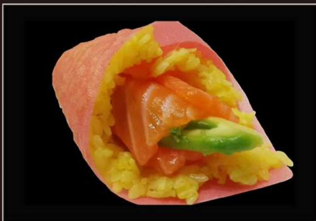
65.Sake temaki Salmone, avocado, riso con zafferano