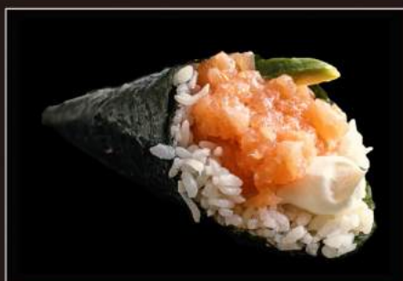
67.Phila temaki Salmone, philadelphia e avocado