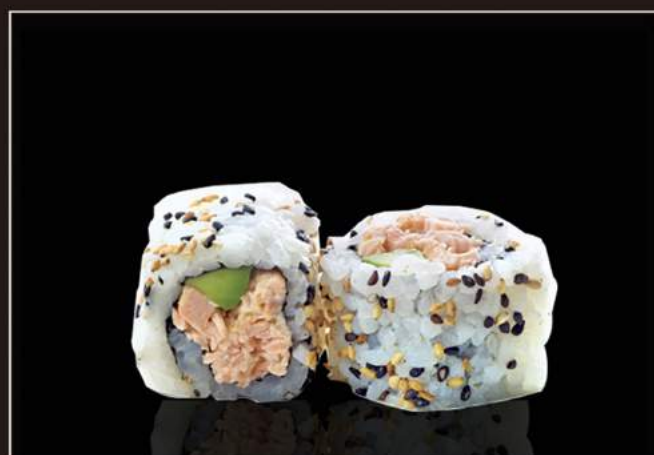
106. Tuna roll Tonno, gambero* al vapore, avocado e maionese